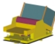
Version motorisée + incloueurs