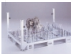
Boîtes de vitesse