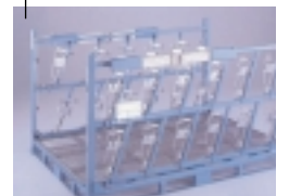
Planches de bord

Grâce à l'emploi des matières premières et des technologies les plus adaptées aux fonctions demandées par le cahier des charges, nos conteneurs spécifiques destinés à l'emballage de pièces diverses sur des flux dédiés sont le résultat de conception intégrant :